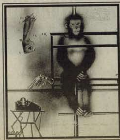
"Ambientación XX", 1991