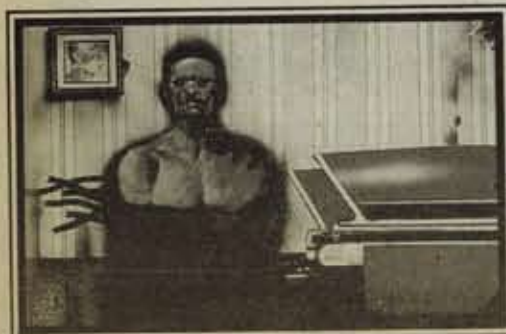
"Sin título", 1990