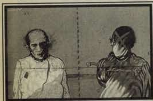
"Sin título", 1983